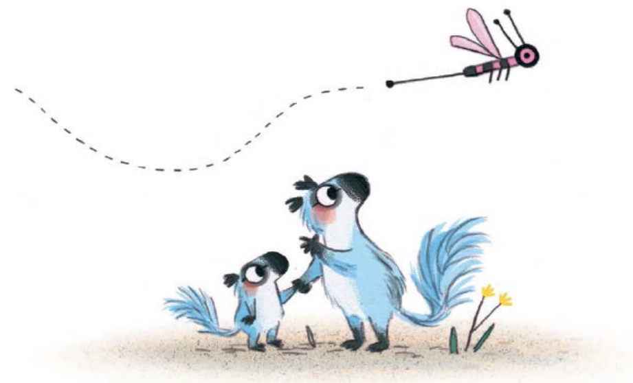
La castora Nora Colección Miau

Primera edición: Marzo, 2026 Título original: The Busiest Beaver Publicado por acuerdo con Simon & Schuster Reino Unido Ltd 1st Floor, 222 Gray's Inn Road, London, WC1X 8HB © Ediciones Jaguar, 2026 C/ Peñuelas 26 C. Local 17-18. 28005 Madrid www.edicionesjaguar.com